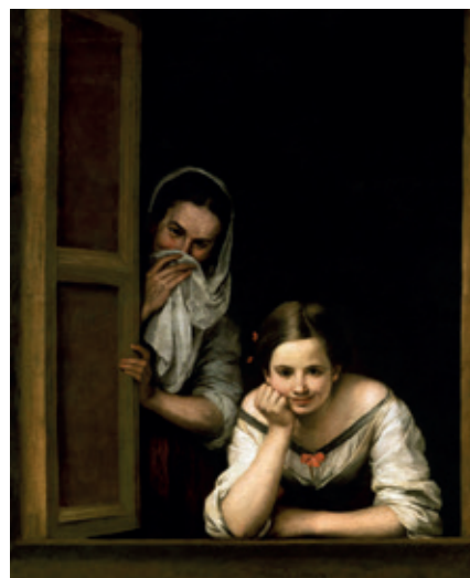
Dos mujeres en la ventana , Bartolomé Esteban Murillo.