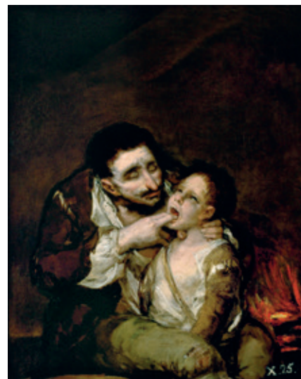
El Lazarillo de Tormes, de Francisco de Goya.