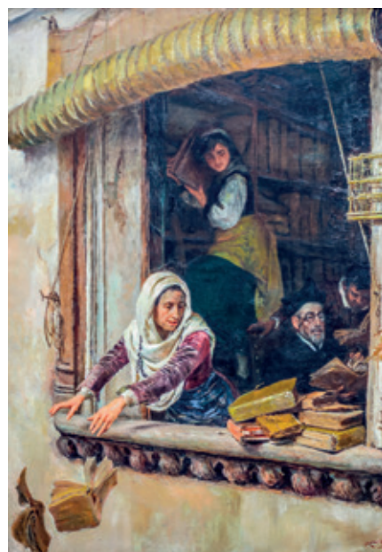
El escrutinio de los libros , de José Moreno Carbonero. Cervantes incluye en su obra algunos juicios sobre crítica literaria, por ejemplo, cuando se produce la quema de libros.