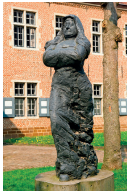
Estatua de una beguina, beguinaje de Diest (lugar declarado patrimonio de la humanidad por la Unesco).